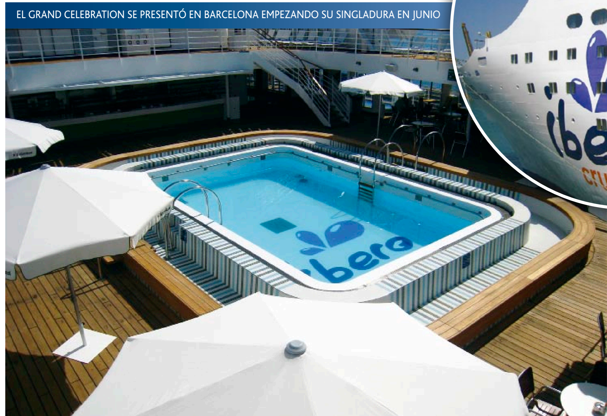
EL GRAND CELEBRATION SE PRESENTÓ EN BARCELONA EMPEZANDO SU SINGLADURA EN JUNIO

El Grand Celebration es un barco totalmente reformado internamente y ha sorprendido positivamente a la crítica especializada. Y lo más importante: a sus pasajeros.